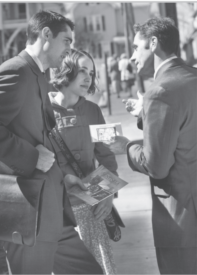
Forkynn med en følelse av at det haster

hendelser i Apostlenes gjerninger, vil hjelpe deg til å se for deg det som skjedde. I mange kapitler er det rammer som kommer med nyttige tilleggsopplysninger. Noen rammer gir et bilde av en bibelsk person som var et godt eksempel ved sin tro. Andre kommer med detaljer om steder, hendelser, skikker eller andre personer som er nevnt i Apostlenes gjerninger.