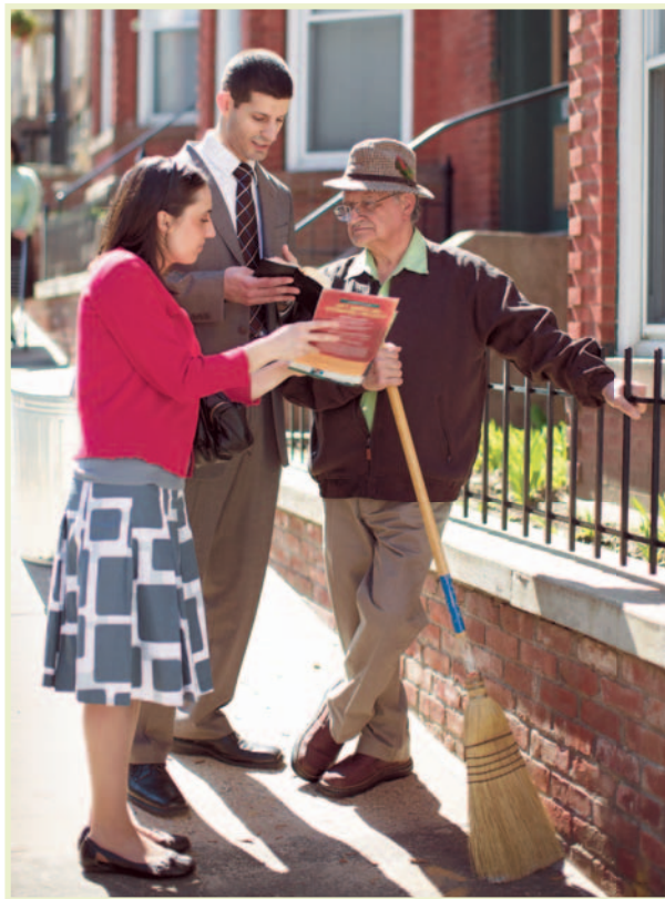
Vi forkynner «fra hus til hus», slik apostlene gjorde

Menn som blir anbefalt til ansvarsoppgaver i menigheten, må vise at de har visdom fra Gud, og det må være tydelig at den hellige ånd virker på dem. Under ledelse av det styrende råd blir menn som oppfyller de bibelske kravene, utnevnt til å tjene som eldste eller menighetstjenere i menighetene.* (1. Tim 3: 1–9, 12, 13) De som oppfyller kravene, kan sies å være utnevnt av hellig ånd. Disse hardtarbeidende mennene tar hånd om mange ‘nødvendige oppgaver’. De kan for eksempel sørge for praktisk hjelp til trofaste eldre som har behov for det. (Jak 1:27) Noen eldste er sterkt engasjert i bygging av Rikets saler, organisering av stevner eller arbeid i sykehuskontaktutvalg. Menighetstjenere tar hånd om mange praktiske oppgaver som ikke har direkte med hyrdearbeid og undervisning å gjøre. Alle slike kvalifiserte menn må sørge for at det er likevekt mellom den tiden de bruker på oppgaver i menigheten og organisasjonen, og den tiden de bruker i forkynnelsesarbeidet. – 1. Kor 9:16.