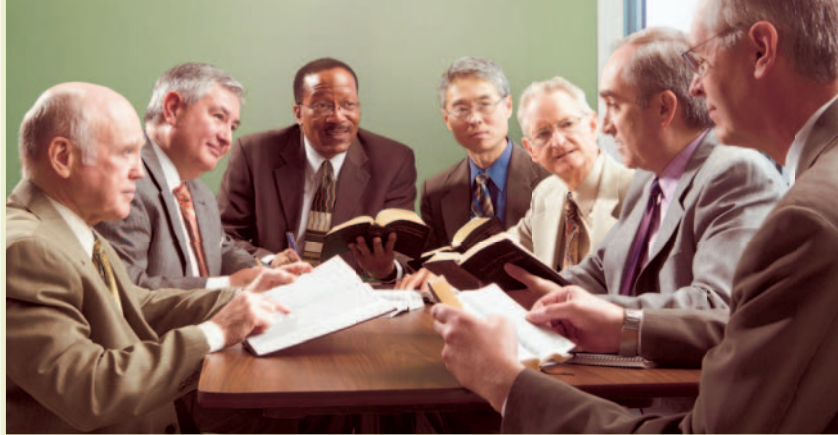
Vi er lydige mot våre utnevnte tilsynsmenn

Den nye apostelen måtte være en som hadde fulgt Jesus gjennom hele hans jordiske tjeneste, og som hadde vært vitne til hans oppstandelse. (Apg 1:21, 22) Det var i harmoni med det løftet Jesus selv hadde kommet med: « Dere som har fulgt meg, [skal] sitte