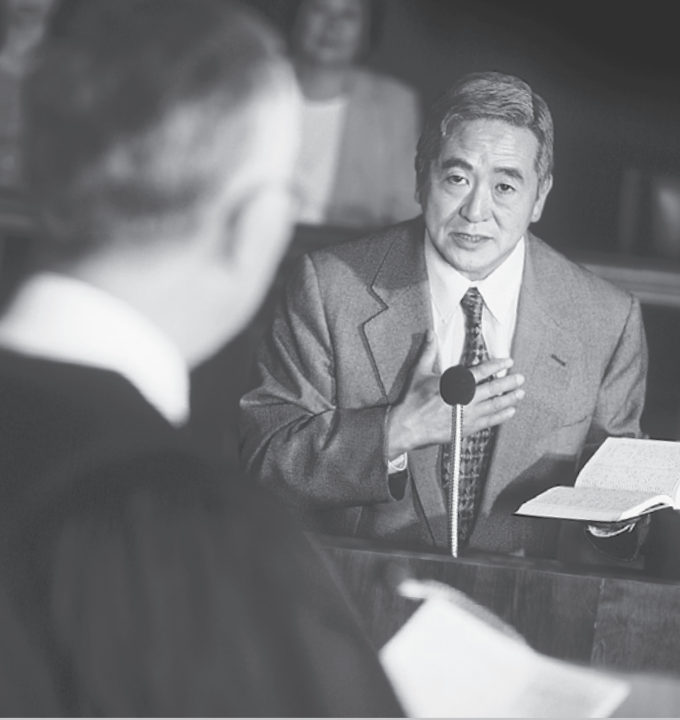
I likhet med Paulus forsvaret vi modig sannheten når vi møter motstand

aldri holde opp med å forvrengje Jehovas rette veier? Nå vil Jehova straffe deg, og du skal bli blind og ikke se sollyset for en tid.' I samme øyeblikk kom det tett tåke og mørke over ham, og han famlet omkring og prøvde å finne noen som kunne leie ham.»* Hva førte denne mirakuløse hendelsen til? «Da prokonsulen så det som hadde skjedd, ble han en troende, for Jehovas lære hadde gjort dypt inntrykk på ham.» – Apg 13:9–12.