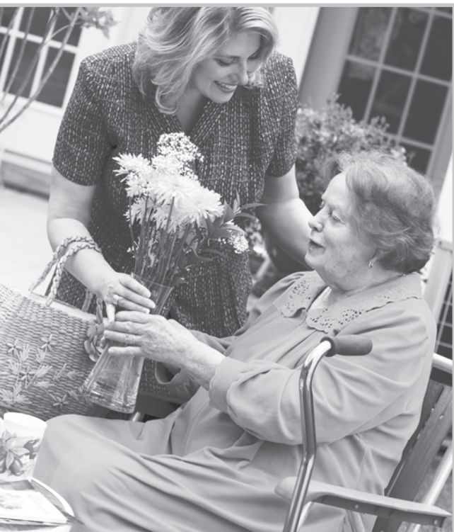
Hvordan kan du etterligne Tabita?

23, 24. (a) Hva lærer vi av beretningen om Tabita? (b) Hva bør vi være fast bestemt på?