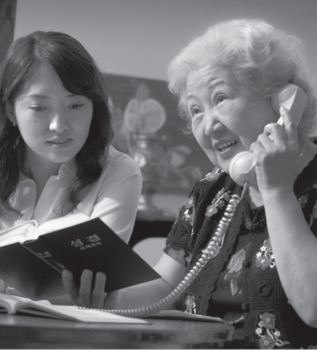
Vi prøver å nå mennesker overalt hvor de er å treffe