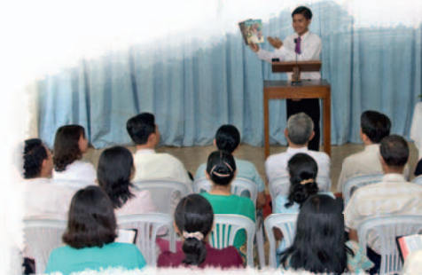
Kediyaz taa tumiye