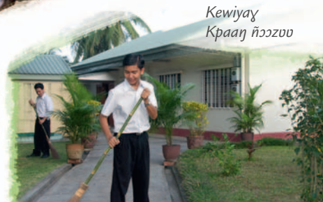
Kewiyay Kraanɗ ñɔkɔzu