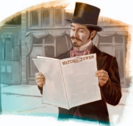
Kajalay Feŋuu Tilimiye Anglɛɛ taa, 1879