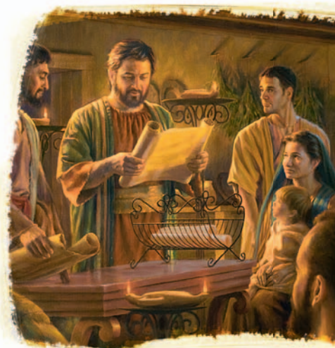
Pɛɔɔɔnɔ kalɔ takayay ɔɔa Nɔɔɔɔyaa eɓbeyɛ mawa yɔ