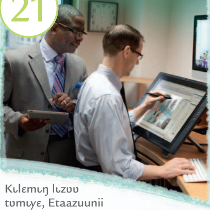
Kulemuj Iuzuu tumuye, Etaazuunii