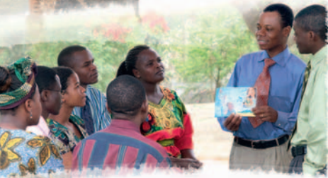
Tom susuu kediyazay