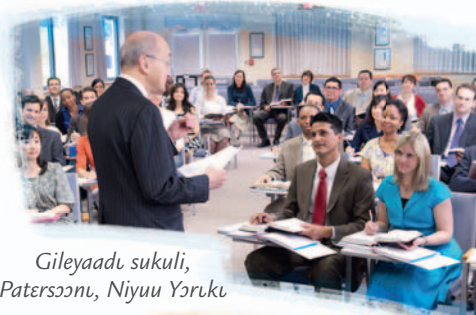
Gileyaadu sukuli, Patersɔɔnɩ, Niyuu Yɔrɩku