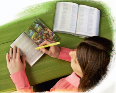
Fezuu taa toonay wazyi da-tuja

Pukazu aluwaatu pazi se Yesu esi le, e ne e-wayu tujayaa naanza (Puyeeru, Yakubu, Yohaneesu ne Andree) palabu keday nakeye. Yesu kaawee ne eyokodu kedezay kuyakuj yusay tom le, epozu tom kubandu tune: “Toovenim taa le, ake yom siysiy tu ne lohsundu weyi e-caa lizaa se econu e-dyaa taa mba yoo ne eha-we pok-toonay aluwaatu ndu tumunaa yo tu-yoo yo?” (Maatiyee 24:3, 45; Maarku 13: 3, 4) Yesu kaakenu “dyudu” ne eha lidau e-wayu tujayaa se ekay luzuu mba pakay hau fezuu taa toonay sakuye e-wayu tujayaa kedezay aluwaatu taa yo. Mba kay kpenduu ne peke yom enu?