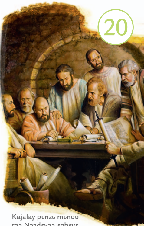
Kajalay pɔnzɔ mɔnsu taa Nɔɔɔɔyaa eɓbeyɛ