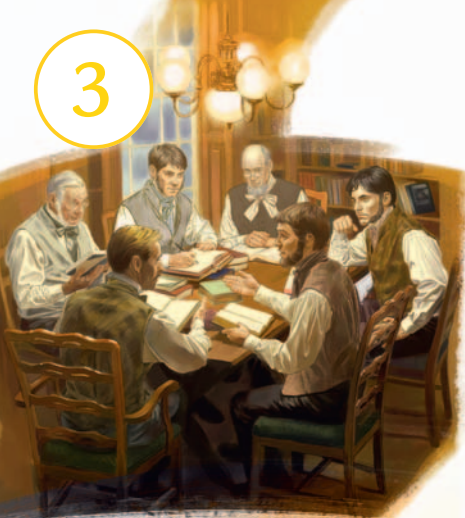
Bibl kpelukiyaa, pɔnzɩ 1870 waa taa