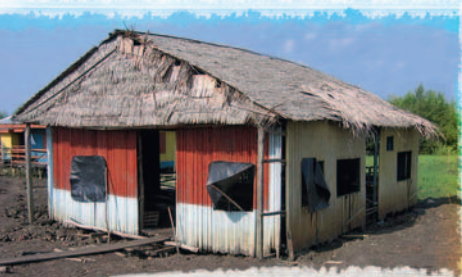
Naajeeriya, զոօօ ԼԷ ne puwayu

Peed՞՞ Yehowa Asey՞՞՞՞ Tւnaa kpeyluj ne ր՞՞ճճճսս pa-tu ne posusuu t՞՞m. (Maatiyee 24:14) Pamay Kewiyay Kpaamuj ԼԷ, ւwenu wetu ndu ndu. Paa՞՞ճճճսս Kewiyay Kpaamuj ne pe՞՞՞՞ԷԼԵՍյ niye. Agbaa sakuye րւսյ ne akpeyli Kewiyay Kpaan kւ՞՞՞՞մսս taa. Pւnzu nzu սւ՞՞՞՞՞ա յ՞՞ ս-տaa agbaa sakuye ճ՞՞ա, mbu yebina ne զմա Kewiyay Kpaamuj kudokuj sakuye. (Paa evemiye ndu ԼԷ, pamay kpaamuj ezu kagbanzu mbu յ՞). Էբե սւսյ-զս ne զսրւսյ ne զլակս tumye ndu?—Maatiyee 19:26.