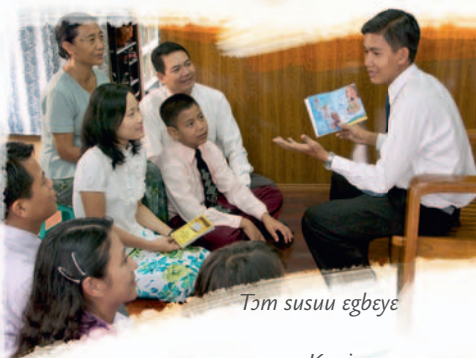
Tɔm susuu egbeyeye