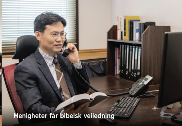
Menigheter får bibelsk veiledning