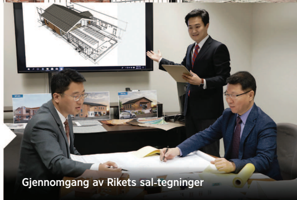
Gjennomgang av Rikets sal-tegninger

For at eksisterende bygninger skal utnyttes best mulig, sørger LDC for at Rikets saler blir inspisert regelmessig. Dette bidrar til at man raskt kan rette opp eventuelle problemer som har med sikkerhet eller vedlikehold å gjøre. LDC sørger også for at menighetens medlemmer får opplæring i vedlikehold.