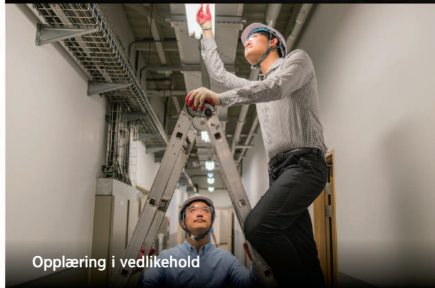
Opplæring i vedlikehold