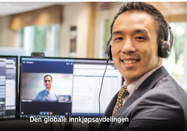
Den globale innkjøpsavdelingen