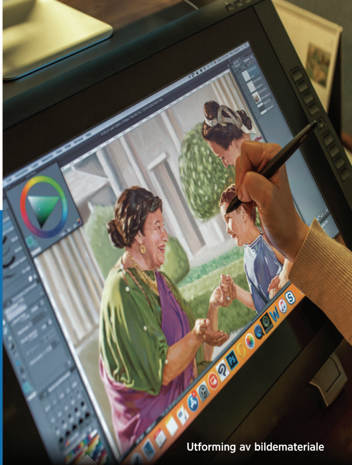
Utforming av bildemateriale