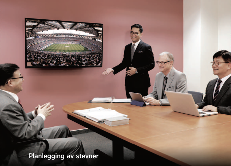
Planlegging av stevner