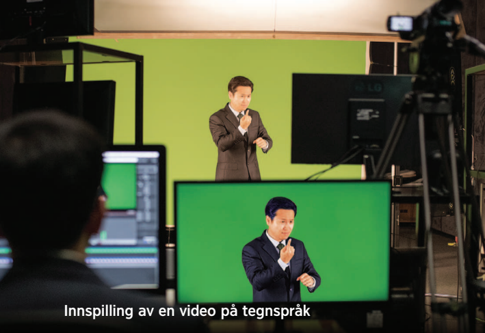
Innspilling av en video på tegnspråk