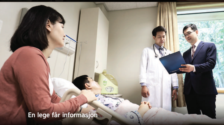
En lege får informasjon