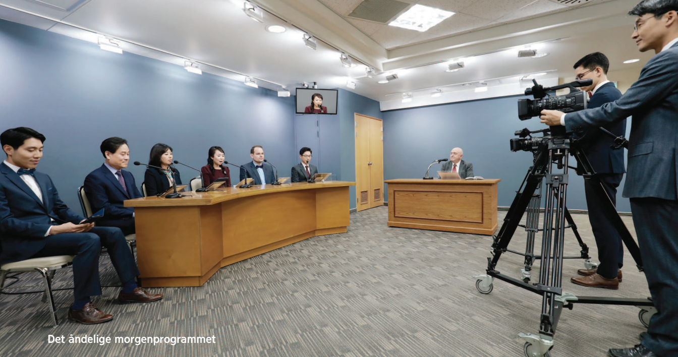
Det åndelige morgenprogrammet