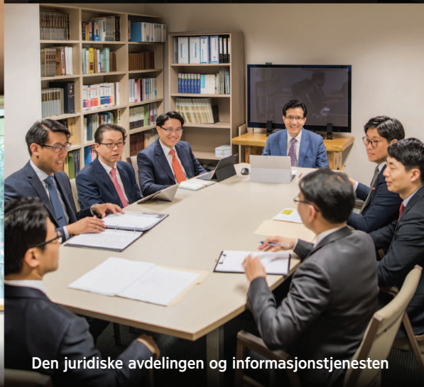
Den juridiske avdelingen og informasjonstjenesten