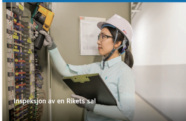
Inspeksjon av en Rikets sal