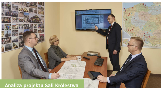
Analiza projektu Sali Królestwa

Biuro Oddziału planuje i nadzoruje budowy Sal Królestwa i Sal Zgromadzeń oraz dba o właściwą konserwację już istniejących obiektów. Budowy koordynuje Lokalny Dział Projektowo-Budowlany. Dzięki temu, że w budowie i konserwacji naszych obiektów uczestniczą ochotnicy, są one niedrogie, praktyczne i wygodne.