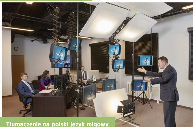
Tłumaczenie na polski język migowy