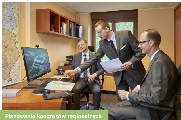
Planowanie kongresów regionalnych