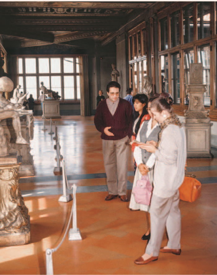
Galleria degli Uffizi, Firenze

preparación personal, y en particular su capacidad de adaptación a los cambios. En consecuencia, es mejor que los estudiantes se hagan adultos teniendo ‘la cabeza bien hecha antes que bien llena’, como dijo el pensador renacentista Montaigne.