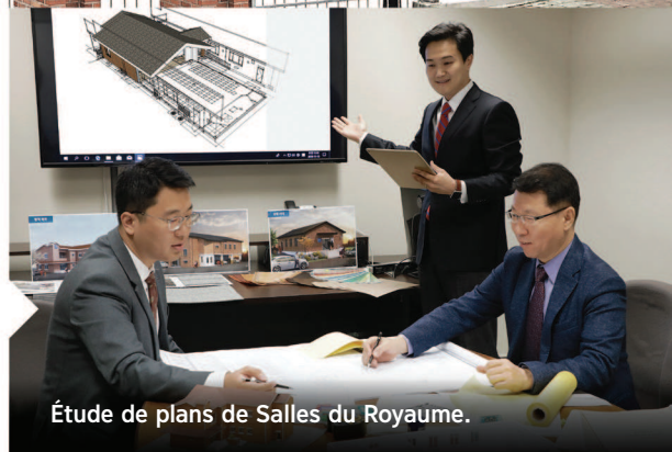
Étude de plans de Salles du Royaume.

Pour tirer le meilleur parti possible de nos Salles du Royaume, le LDC veille à ce qu'elles soient régulièrement inspectées. Cela permet de régler rapidement tout problème lié à la sécurité ou à la maintenance. Le LDC apporte aussi aux membres des assemblées locales une formation à la maintenance.