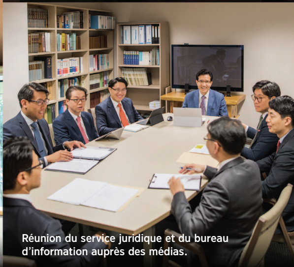
Réunion du service juridique et du bureau d'information auprès des médias.