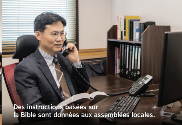
Des instructions basées sur la Bible sont données aux assemblées locales.