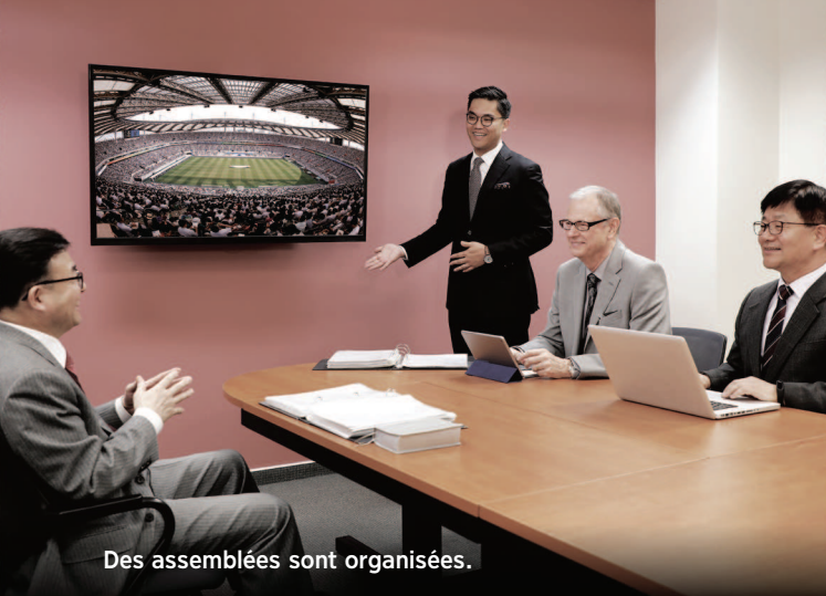
Des assemblées sont organisées.