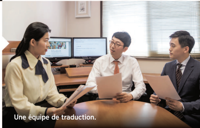
Une équipe de traduction.

Nous traduisons des publications bibliques en coréen et nous produisons des enregistrements de nos traductions. Nous traduisons aussi des chansons et divers contenus, plans et programmes pour nos réunions, nos assemblées, le site jw.org et JW Télédiffusion. De plus, nous produisons de nombreuses publications en braille et nous traduisons et enregistrons des publications en langue des signes coréenne. Tous ceux qui sont conscients de leurs besoins spirituels sont ainsi en mesure de les combler.