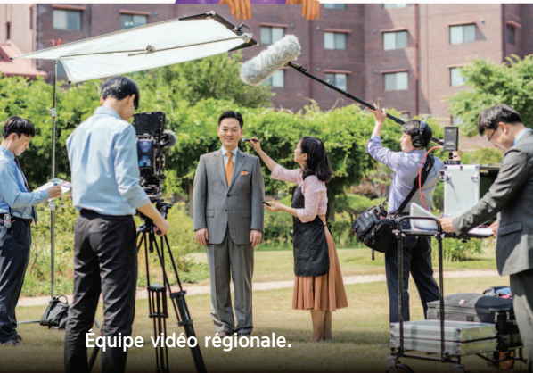
Équipe vidéo régionale.