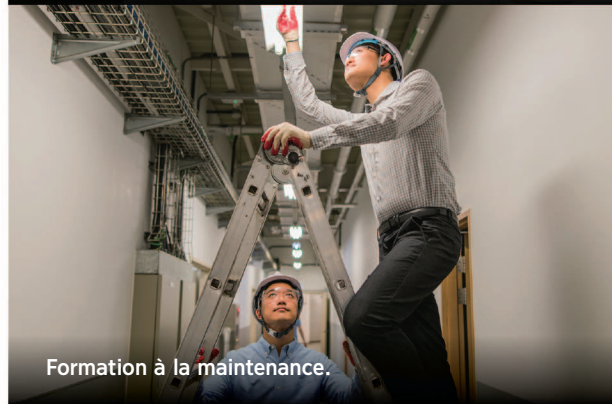
Formation à la maintenance.