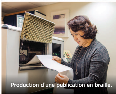
Production d'une publication en braille.