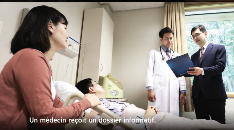
Un médecin reçoit un dossier informatif.