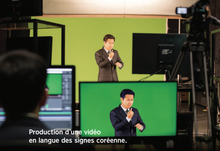
Production d'une vidéo en langue des signes coréenne.