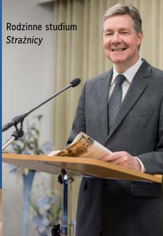
Rodzinne studium Strażnicy