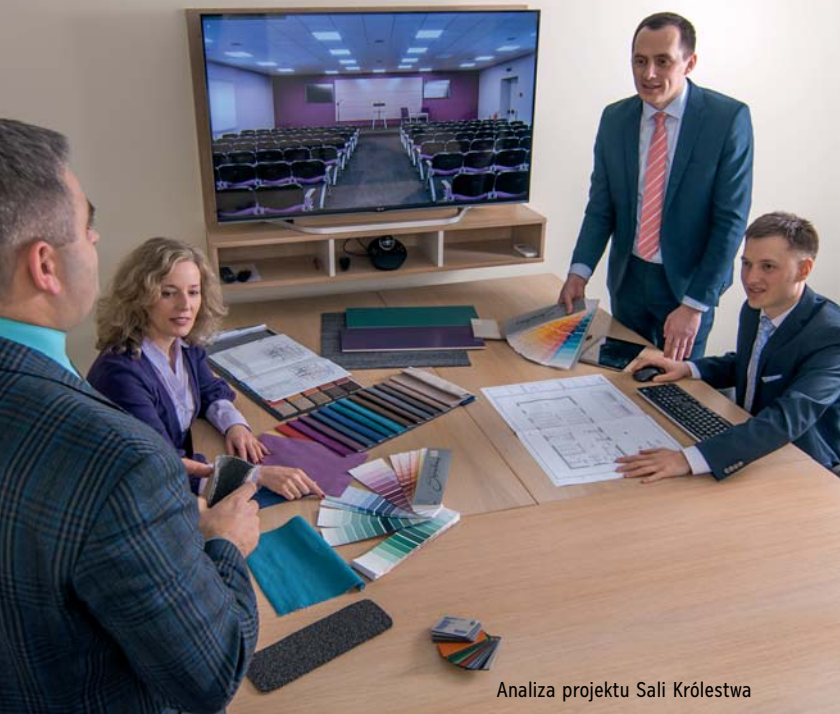
Analiza projektu Sali Królestwa