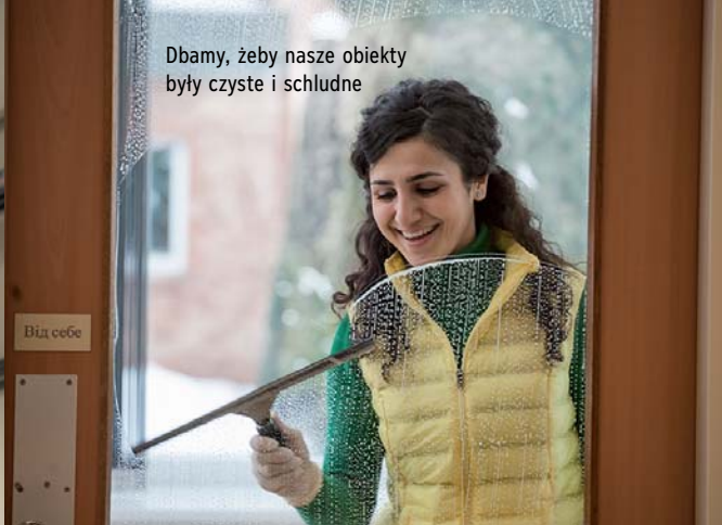
Dbamy, żeby nasze obiekty były czyste i schludne