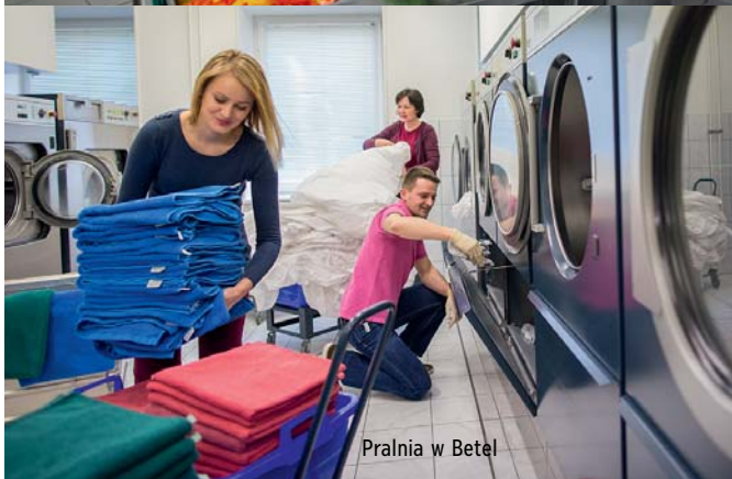
Pralnia w Betel