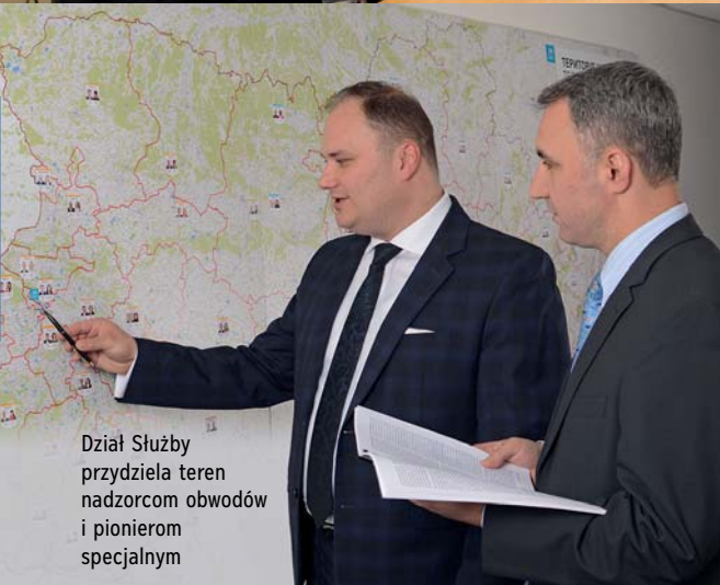
Dział Służby przydziela teren nadzorcom obwodów i pionierom specjalnym