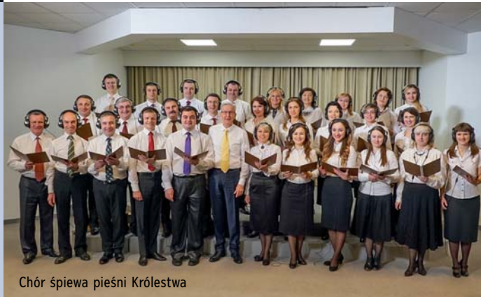
Chór śpiewa pieśni Królestwa