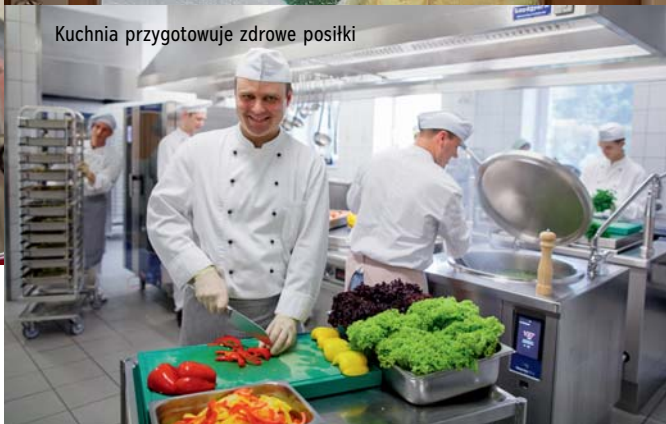
Kuchnia przygotowuje zdrowe posiłki