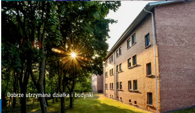
Dobrze utrzymana działka i budynki

Biuro Oddziału na Ukrainie nie mogłoby funkcjonować bez pomocy wielu ochotników, którzy pracują w innych działach. Niektórzy członkowie rodziny Betel usługują w kuchni, jadalni, pralni, są fryzjerami, dbają o czystość, szyją, pracują w ogrodzie albo są kierownikami. Jeszcze inni dbają o instalacje grzewcze, hydrauliczne i elektryczne, obsługują różne urządzenia mechaniczne i systemy komputerowe. Wielu ochotników dojeżdża do Biura Oddziału jeden lub dwa dni w tygodniu. Bez względu na to, jakie powierzono nam zadanie, dla wszystkich nas służenie naszemu Bogu, Jehowie, oraz usługiwanie braciom i siostram uważamy za zaszczyt.