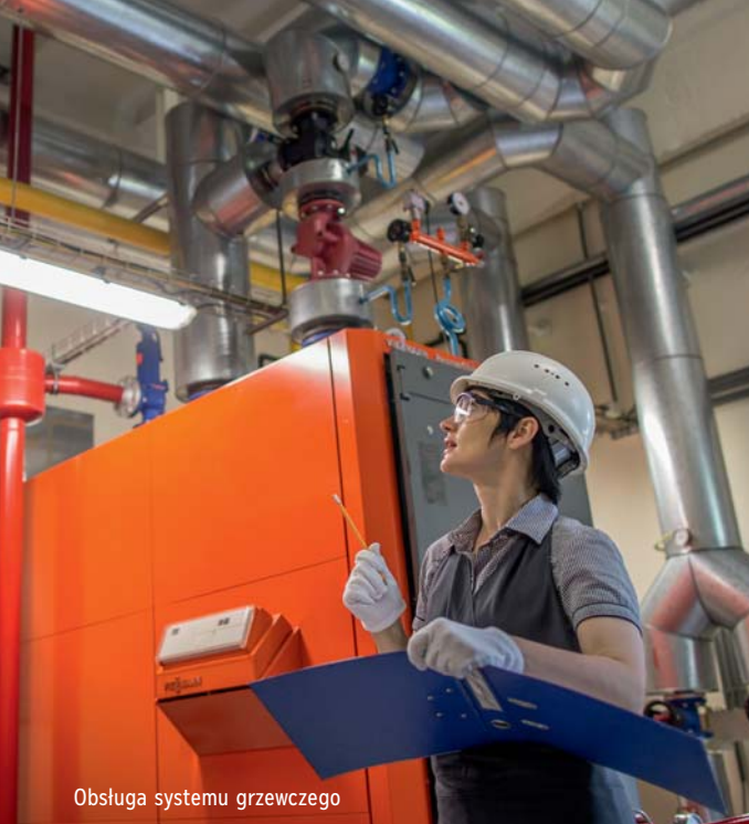
Obsługa systemu grzewczego