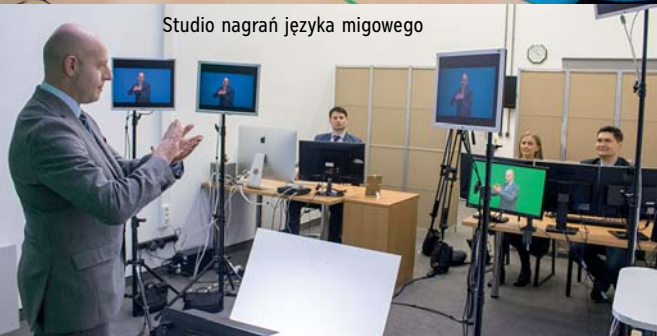
Studio nagrań języka migowego