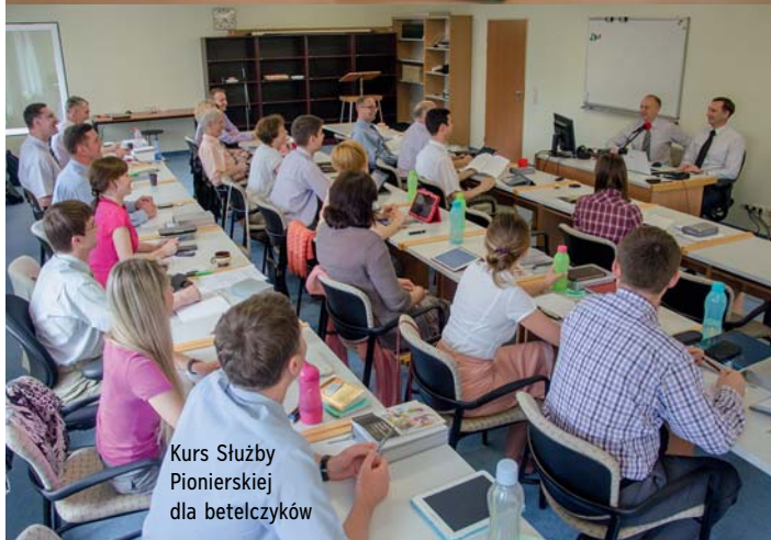
Kurs Służby Pionierskiej dla betelczyków