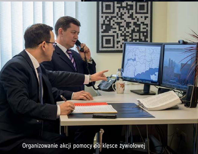
Organizowanie akcji pomocy po klęsce żywiołowej