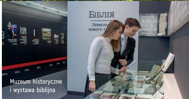
Музей історичний і вистава біблійна

Mogłeś się dowiedzieć, na jakie wysiłki zdobywają się Świadkowie Jehowy, żeby rozgłaszać dobrą nowinę o Królestwie Jehowy. Wierzmy, że zachęci cię to do dalszego poznawania naszego kochającego Stwórcy i do kierowania się w życiu Jego wzniosłymi zasadami.