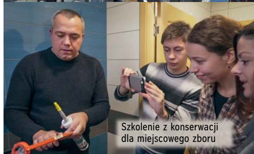
Szkolenie z konserwacji dla miejscowego zboru