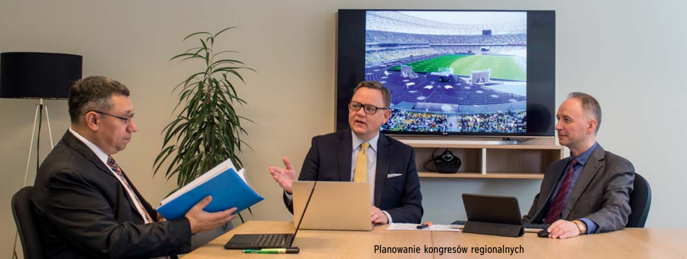
Planowanie kongresów regionalnych